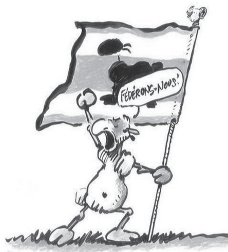
DR - Merci pour ce dessin