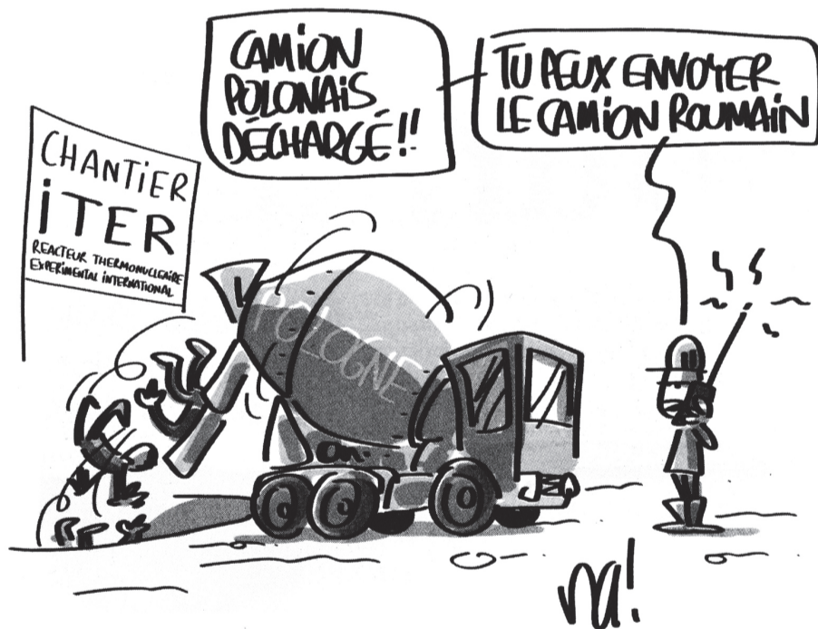
DR - Merci pour ce dessin

Mais à prendre exemple sur Flamanville, la direction d'ITER et le consortium choisi pour la construction des bâtiments (Vinci/Ferrovial/Razel-Bec), semblent emprunter le même chemin que Bouygues qui devrait être lourdement condamné pour avoir employé illégalement près de 500 ouvriers polonais et roumains, via deux sociétés, sur le chantier du réacteur nucléaire EPR à Flamanville (le procès prévu en octobre dernier a été repoussé en mars 2015).